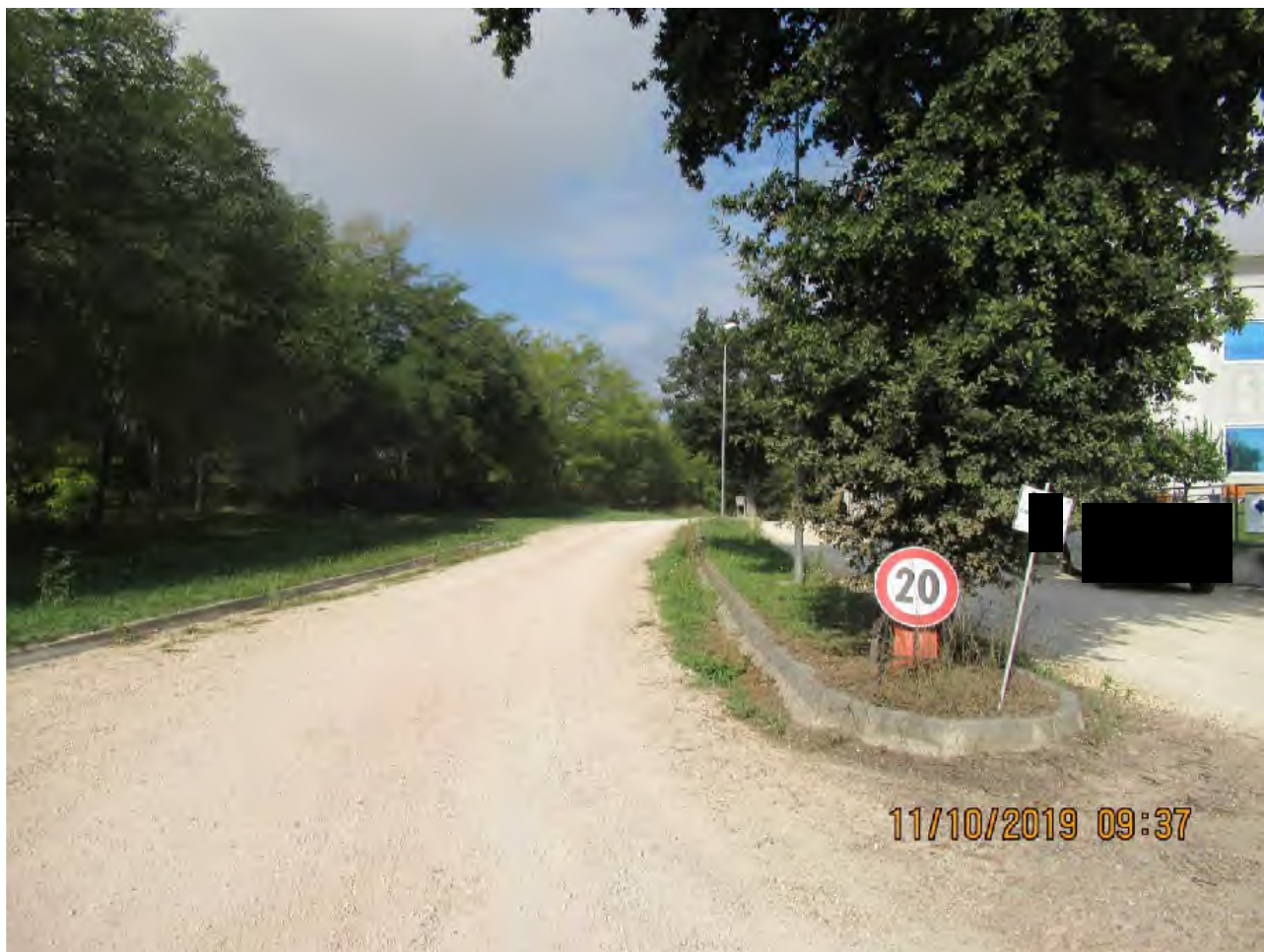
VISTA AREE DI PL