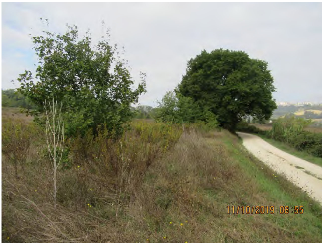
VISTA TERRENI AGRICOLI