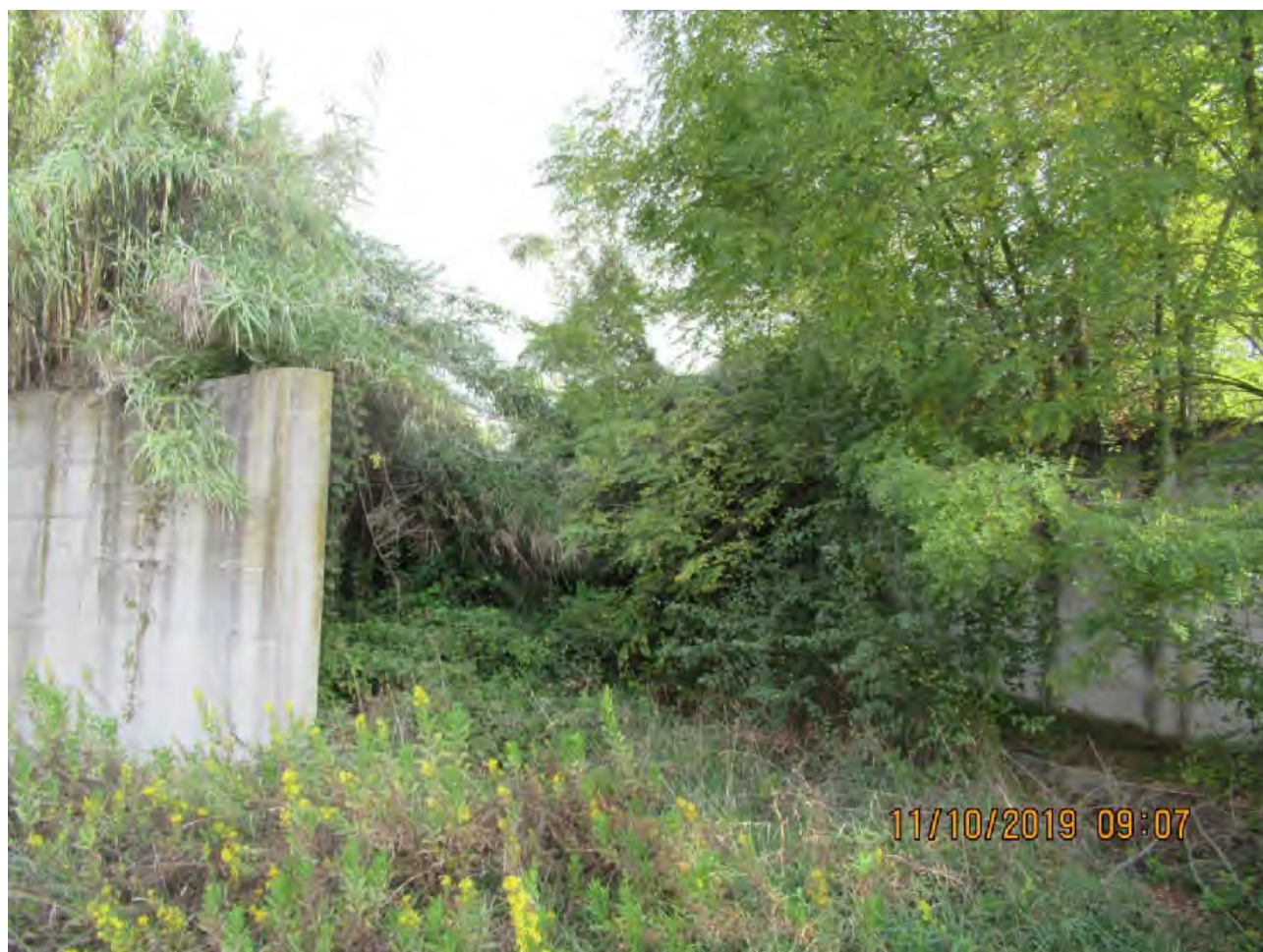
VISTA AREE DI PL