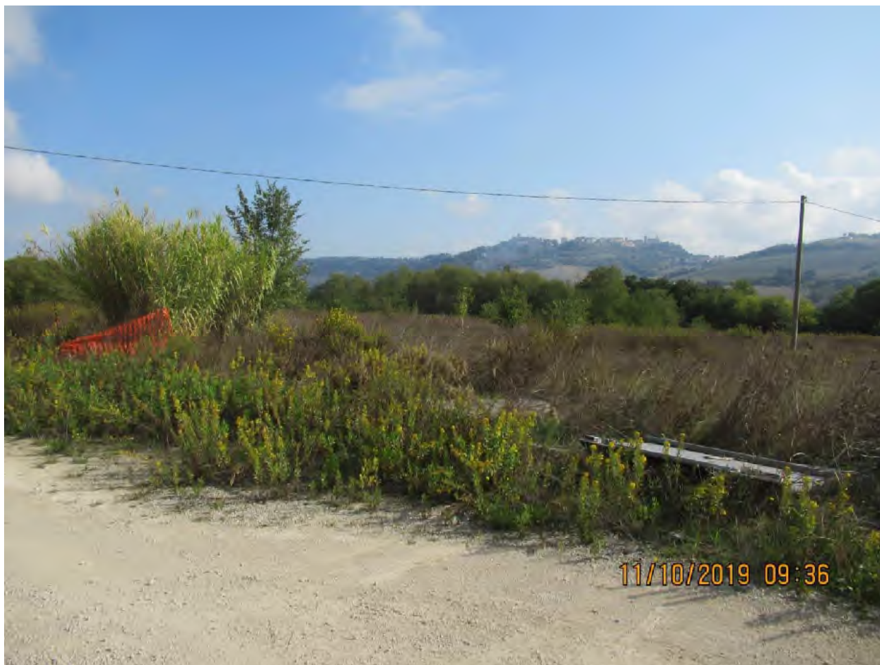
VISTA AREE DI PL