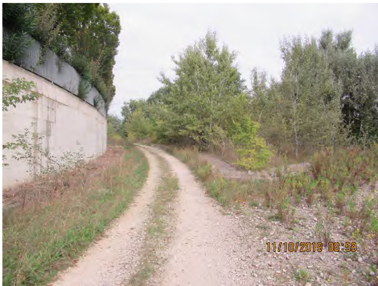
VISTA AREE DI PL