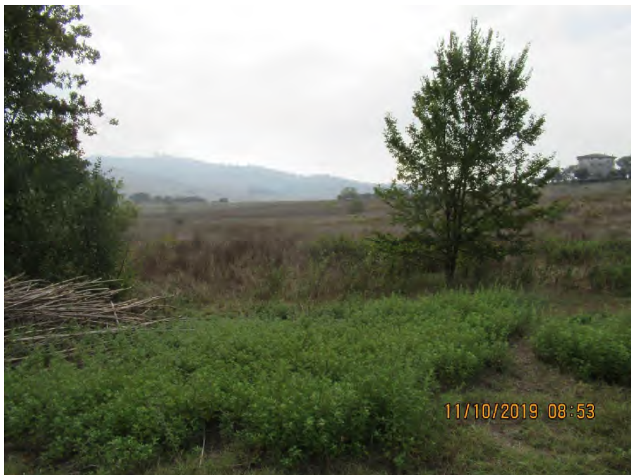
VISTA TERRENI AGRICOLI