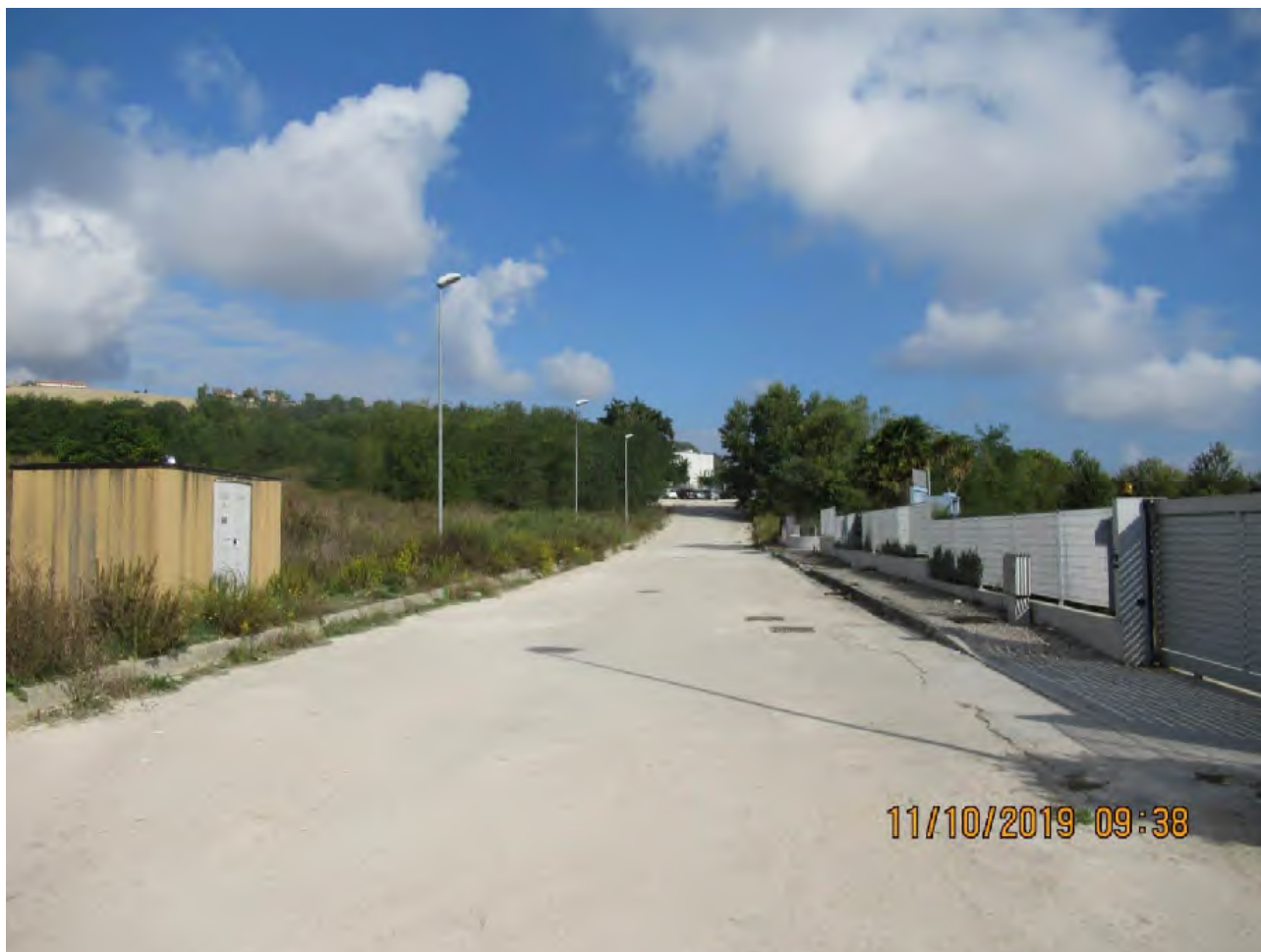
VISTA AREE DI PL