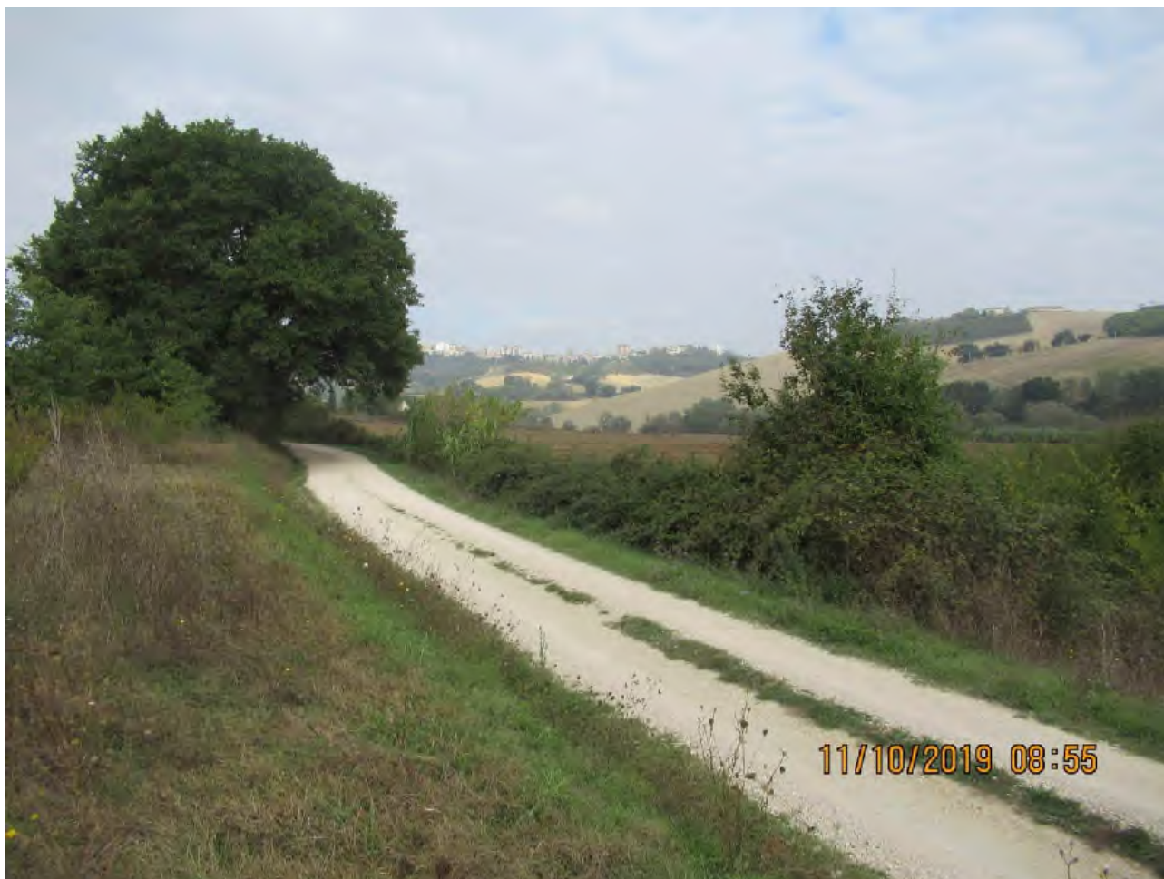
VISTA TERRENI AGRICOLI