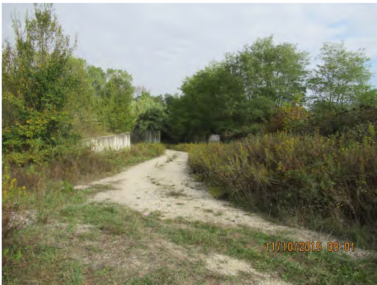
VISTA AREE DI PL