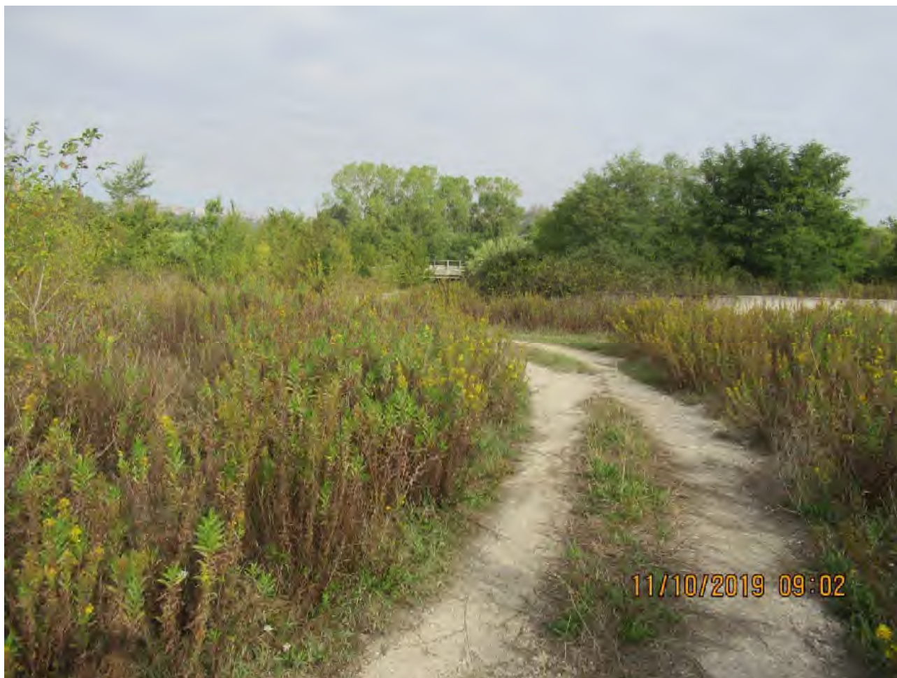
VISTA AREE DI PL