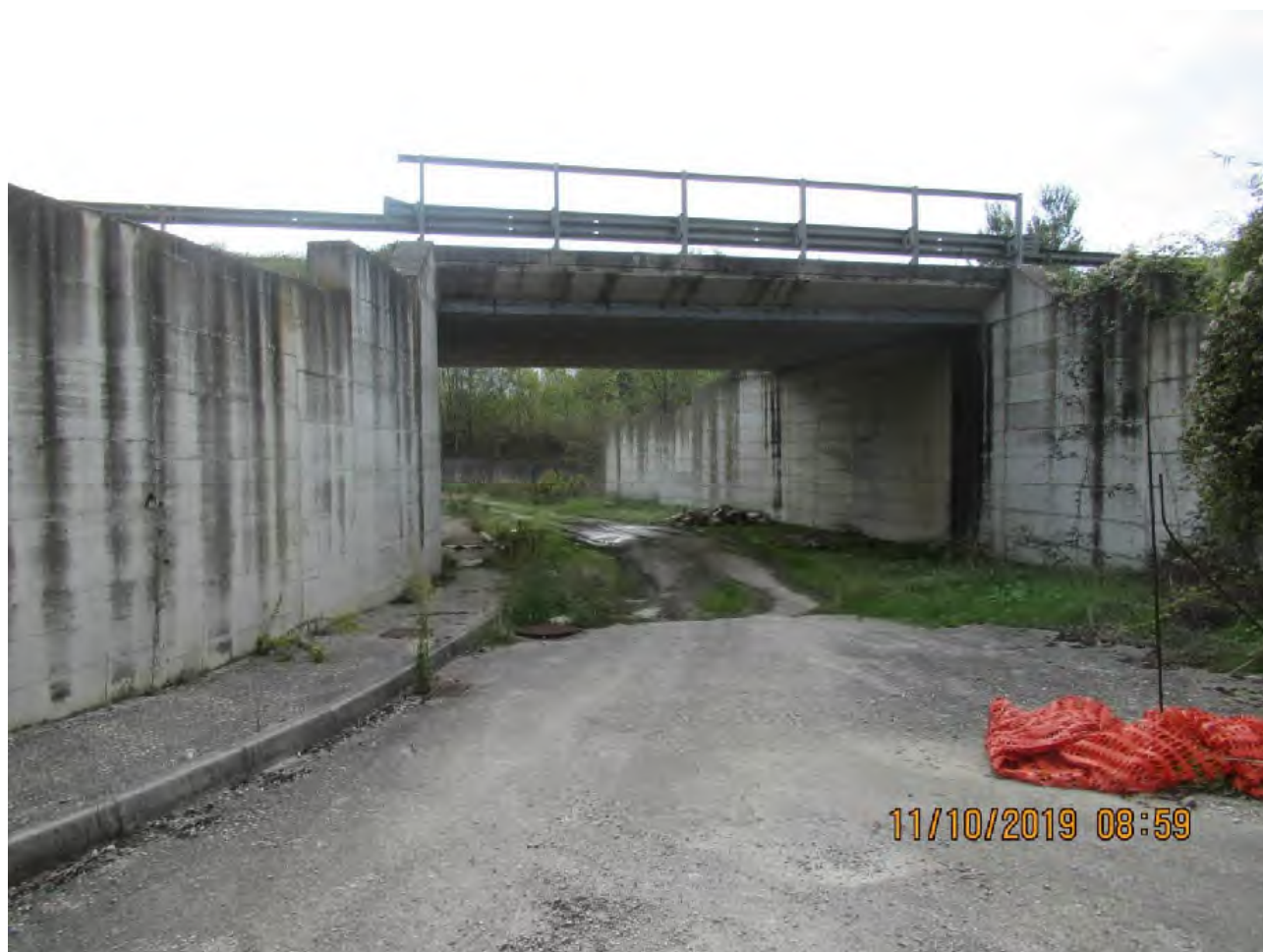
VISTA AREE DI PL