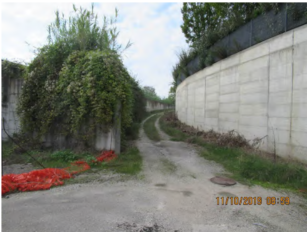
VISTA AREE DI PL