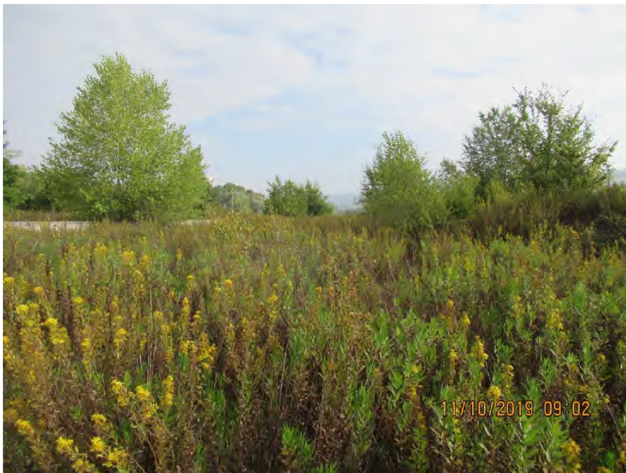
VISTA AREE DI PL