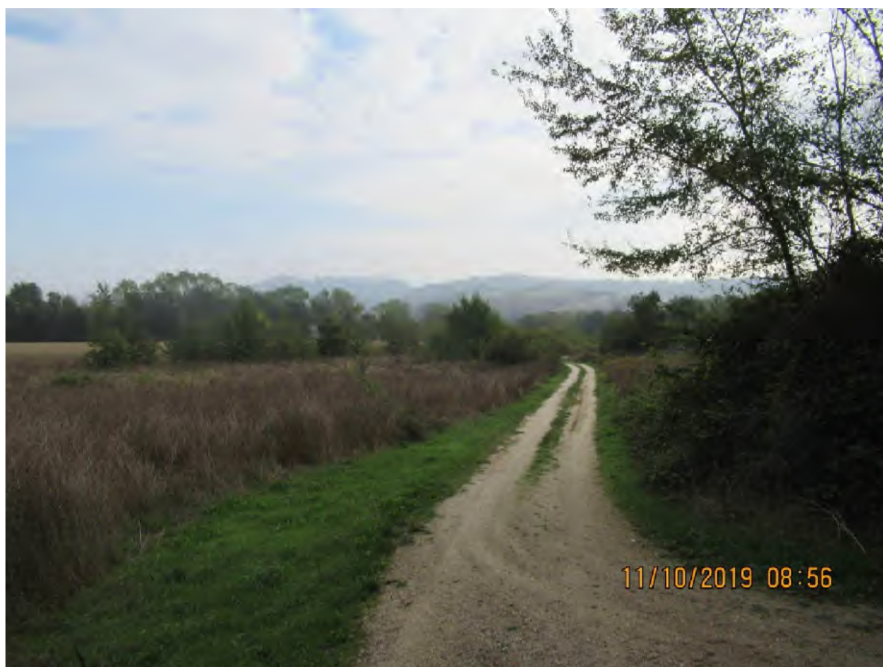
VISTA TERRENI AGRICOLI