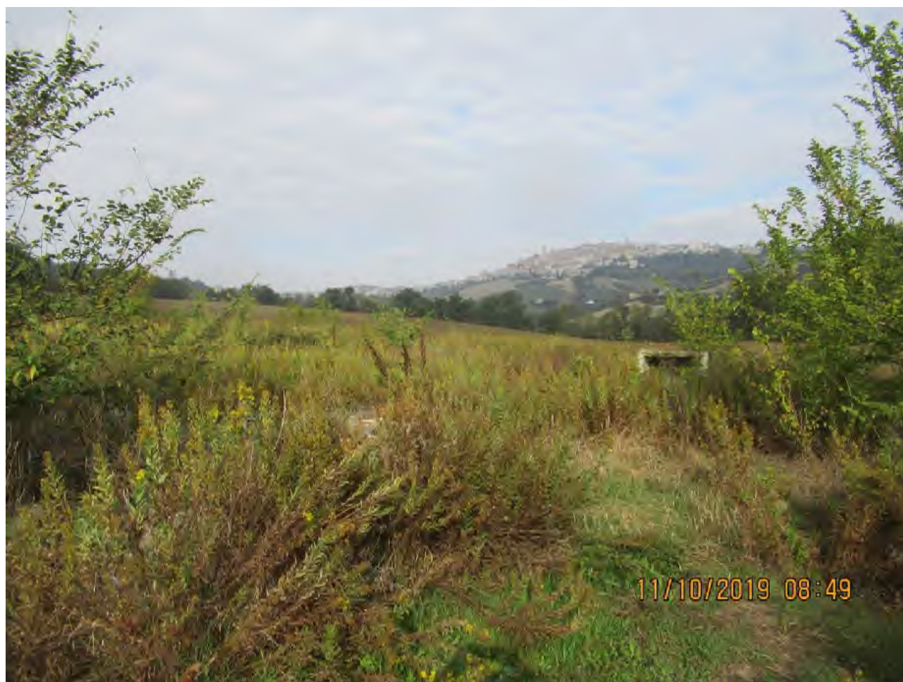
VISTA TERRENI AGRICOLI