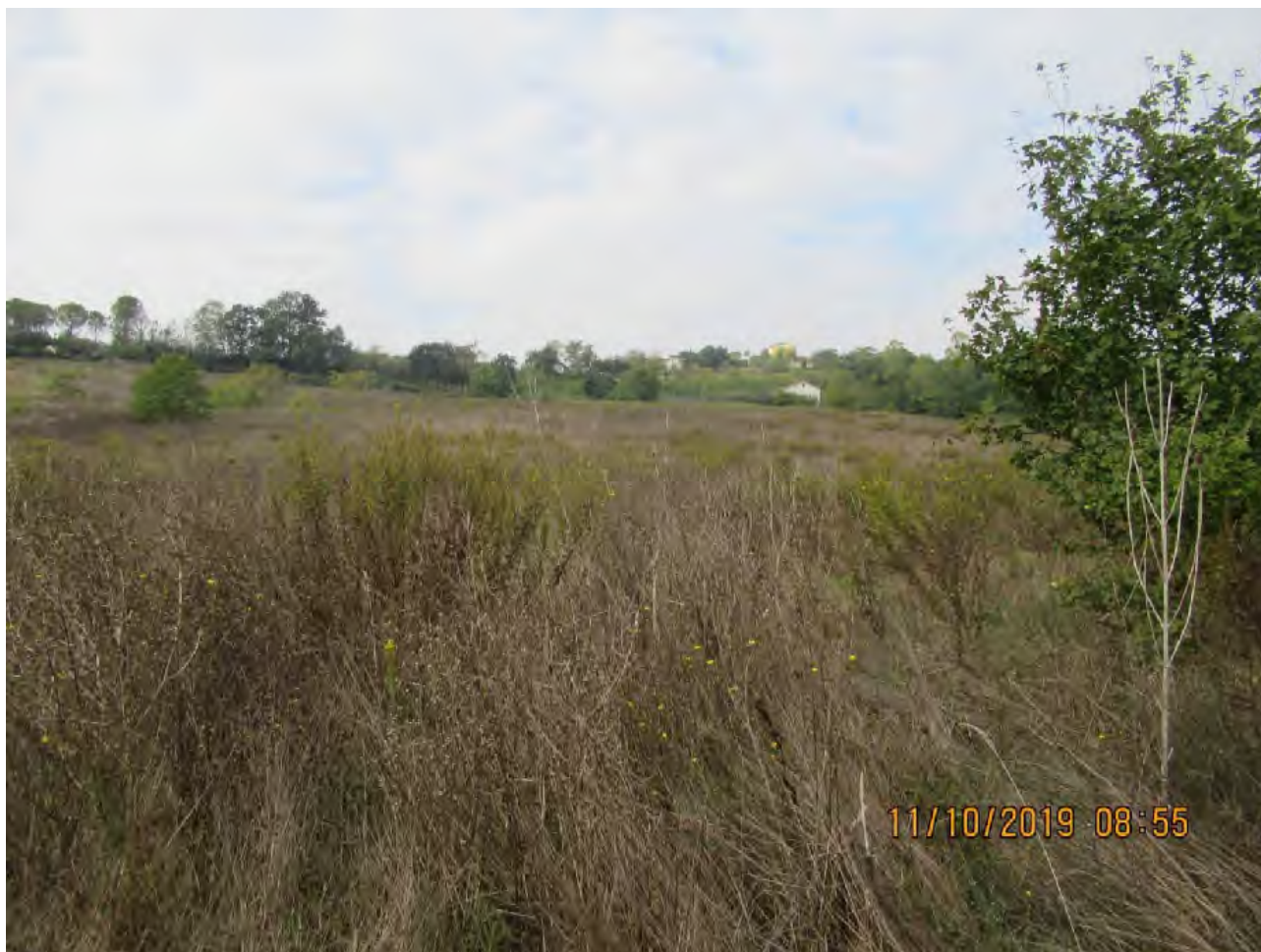
VISTA TERRENI AGRICOLI