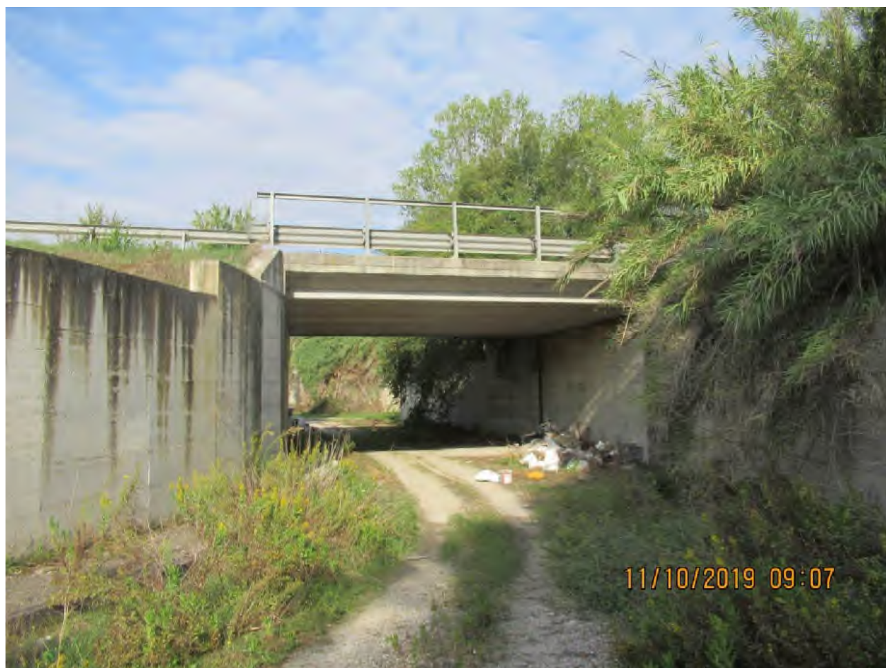
VISTA AREE DI PL