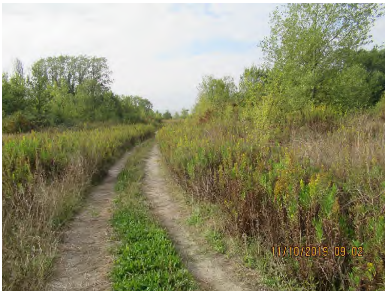
VISTA AREE DI PL