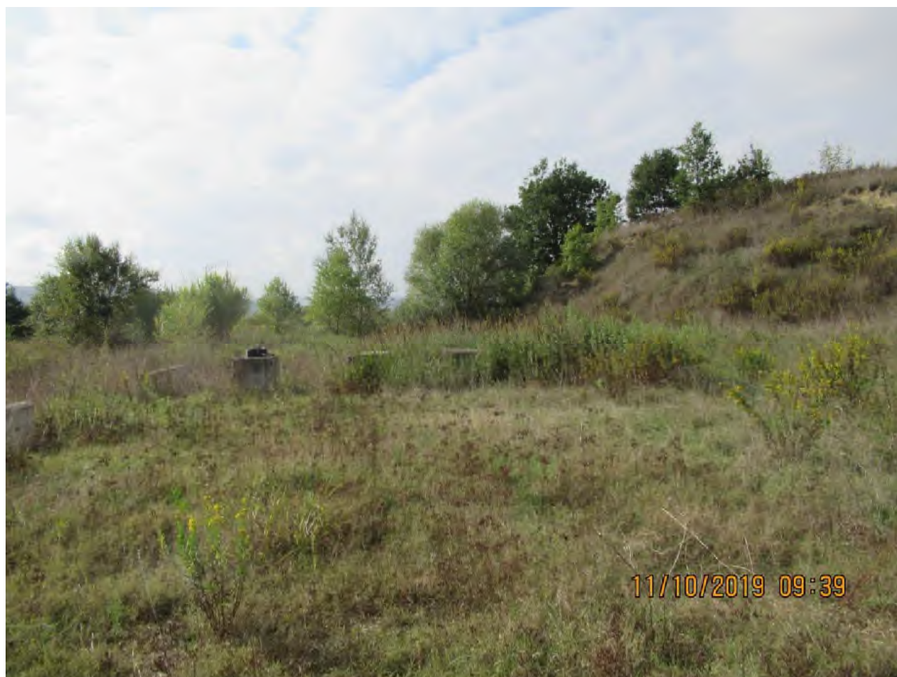
VISTA AREE DI PL