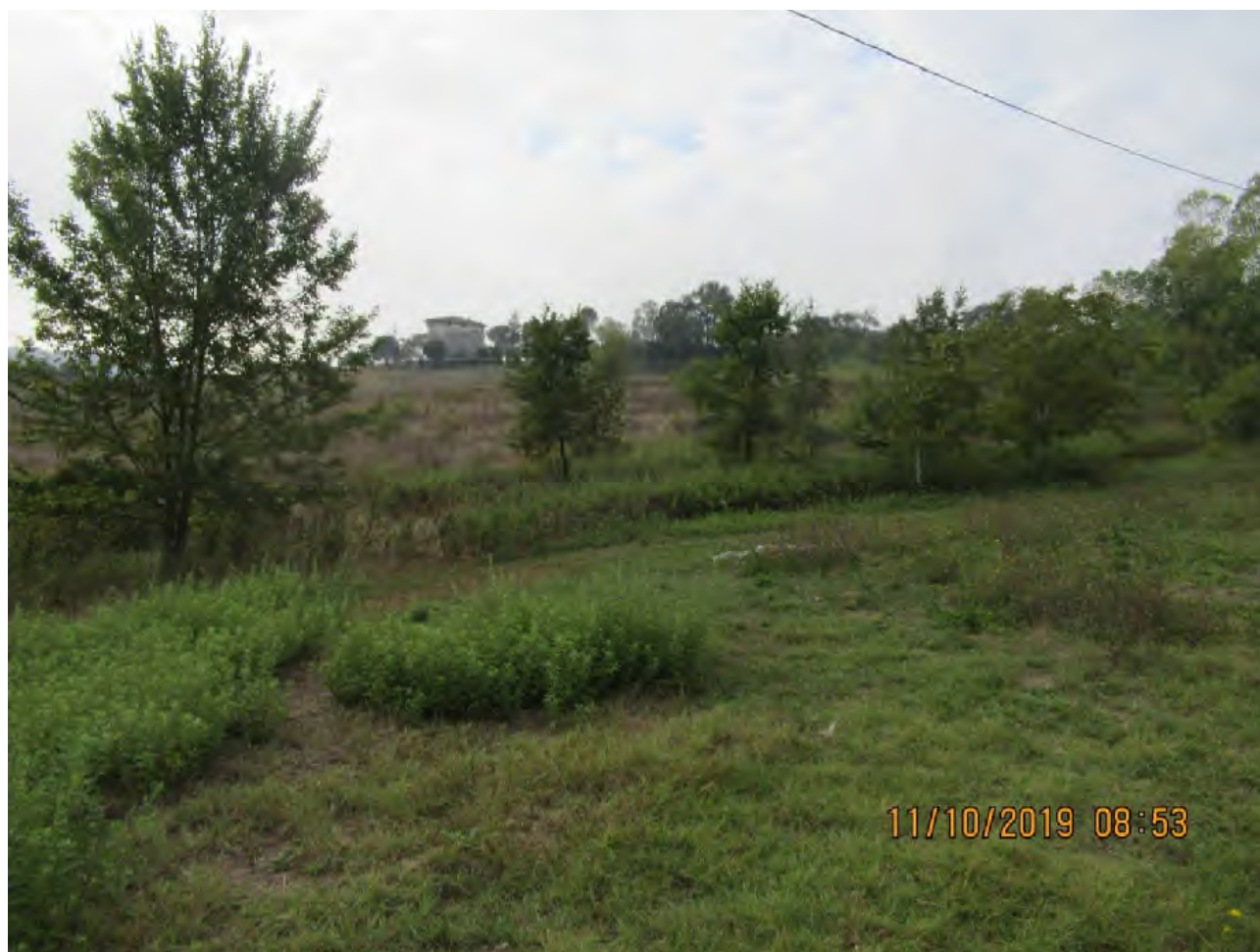
VISTA TERRENI AGRICOLI