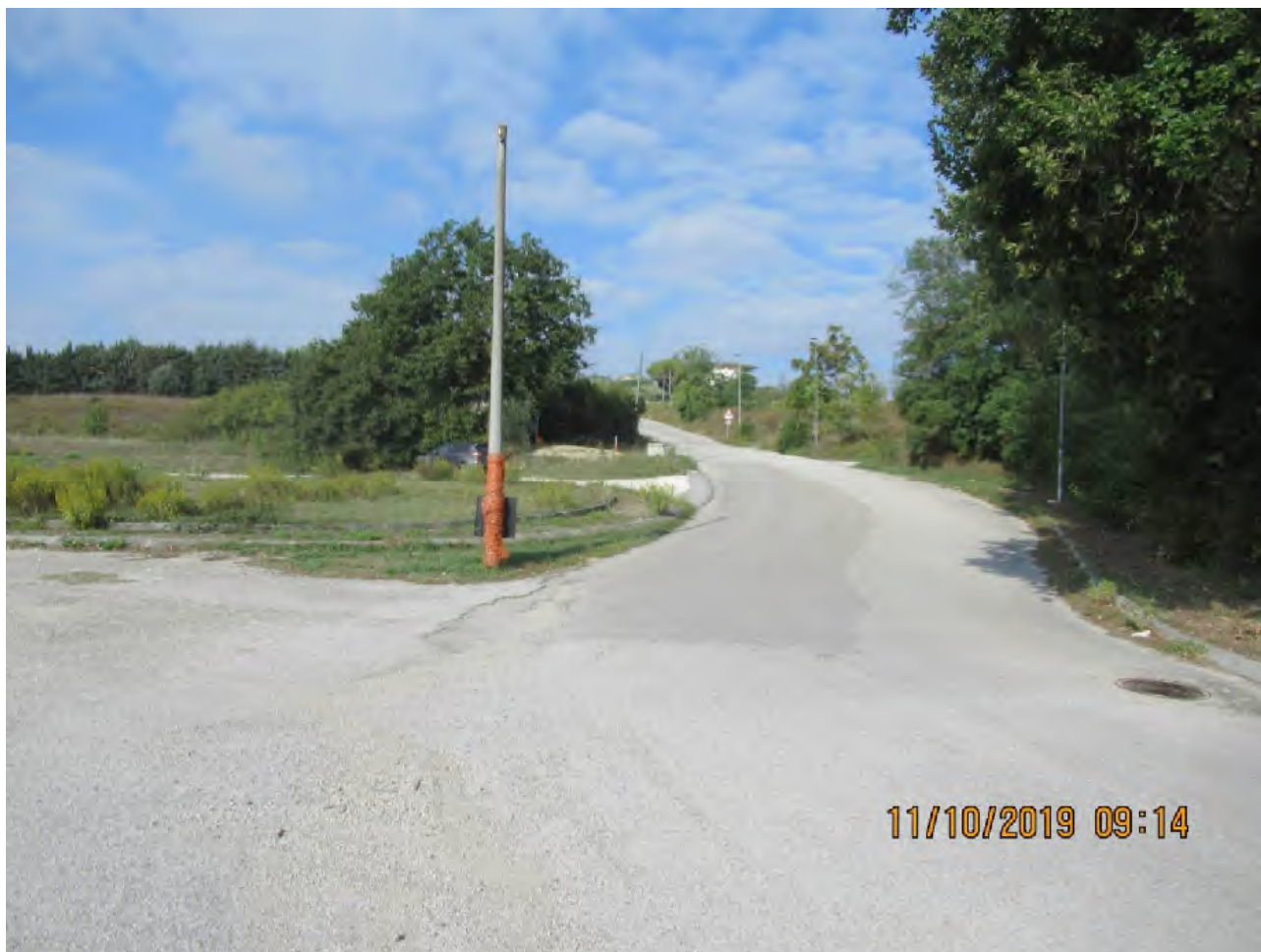
VISTA AREE DI PL