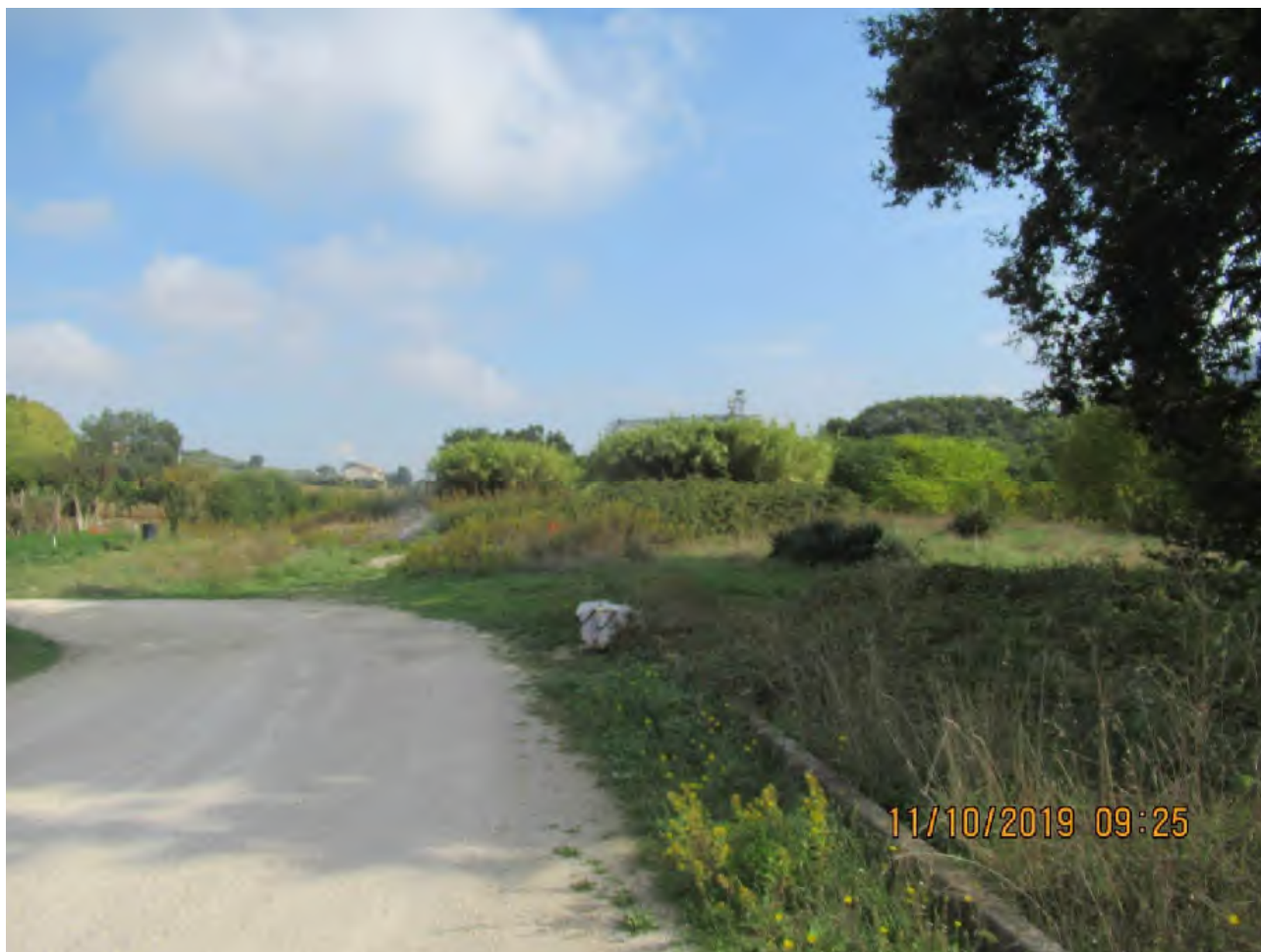
VISTA AREE DI PL