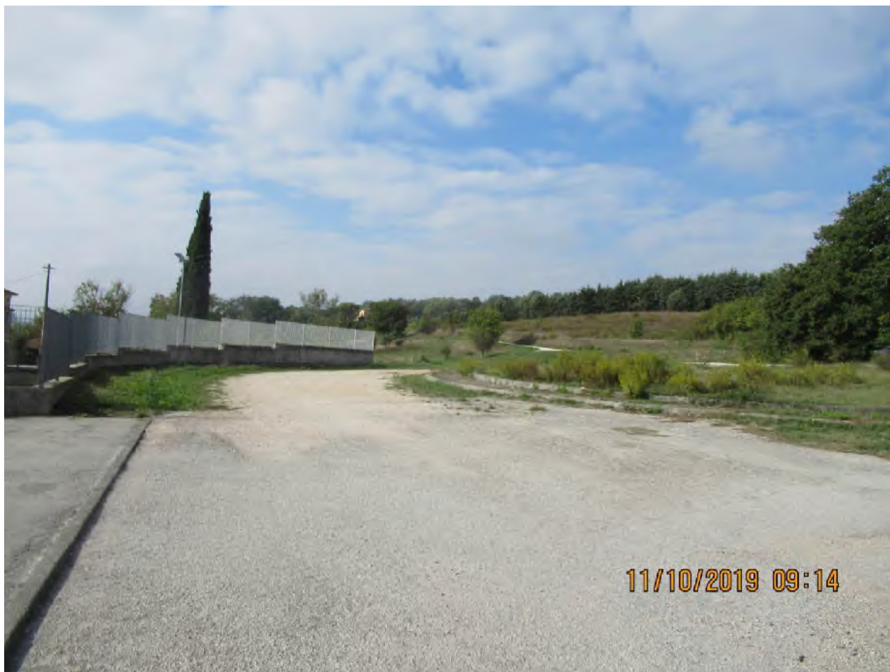
VISTA AREE DI PL