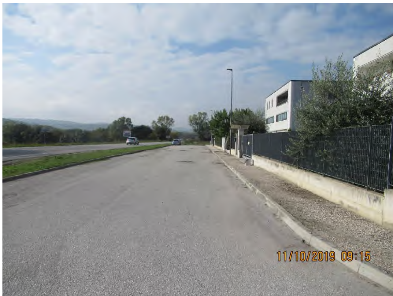
VISTA AREE DI PL