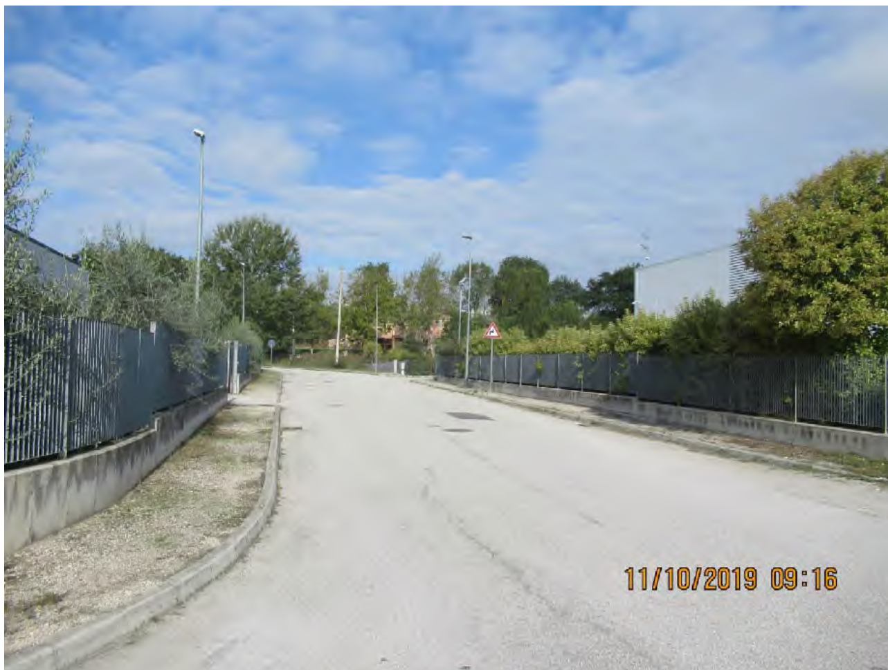
VISTA AREE DI PL