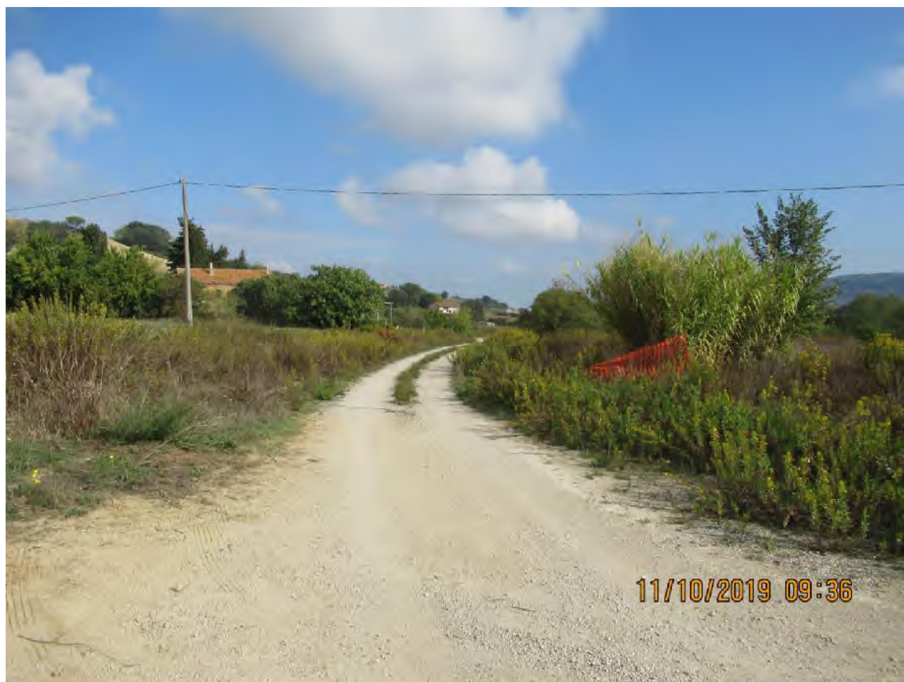
VISTA AREE DI PL