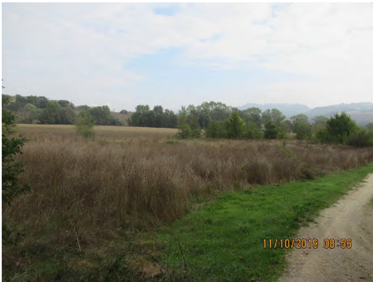
VISTA TERRENI AGRICOLI