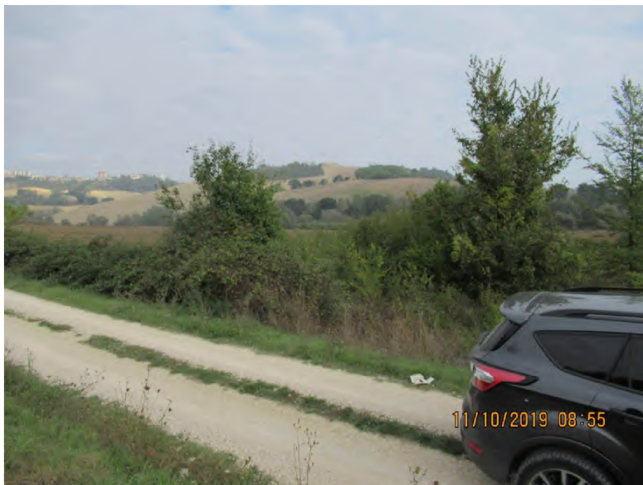
VISTA TERRENI AGRICOLI