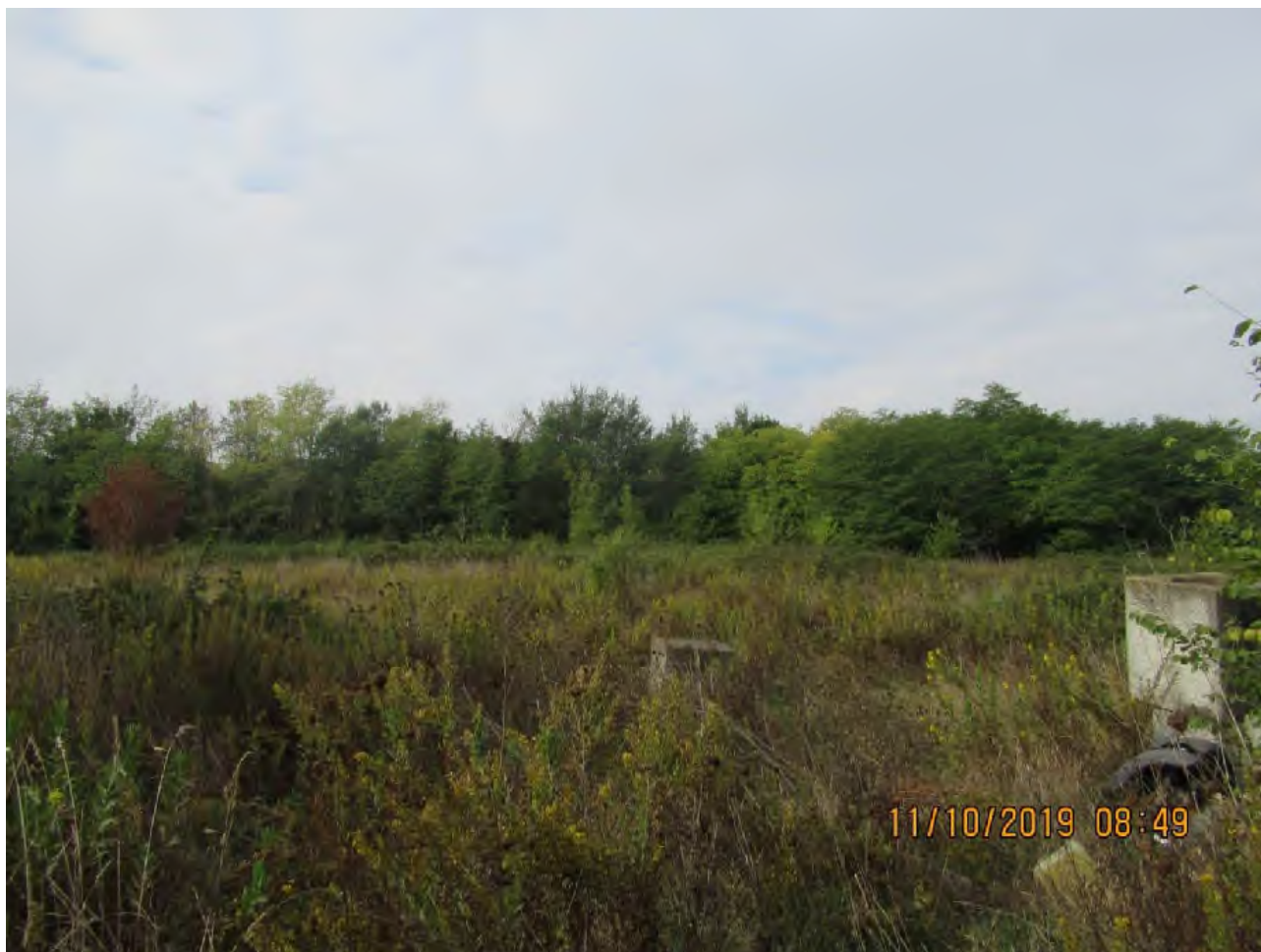
VISTA TERRENI AGRICOLI