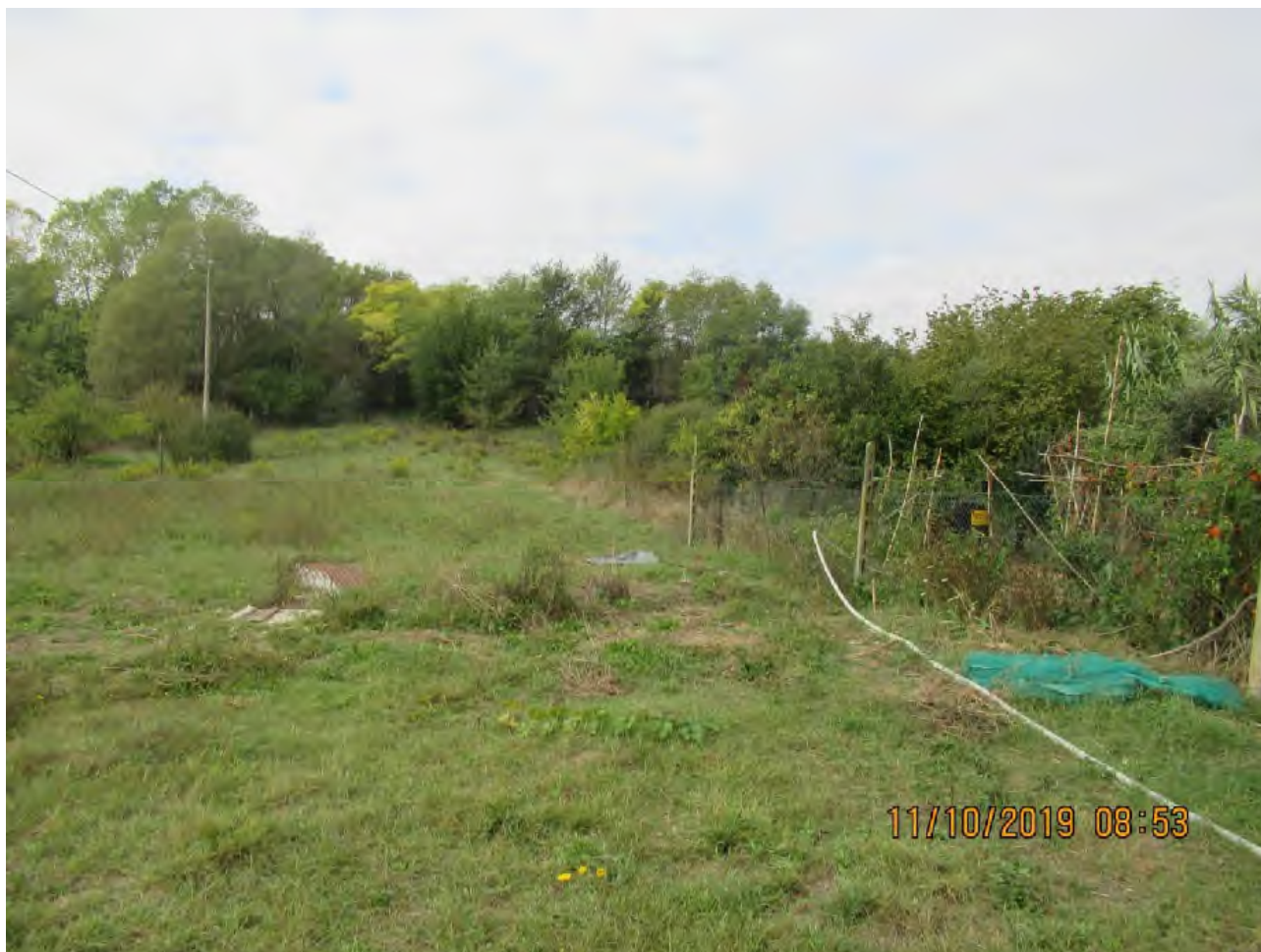
VISTA TERRENI AGRICOLI