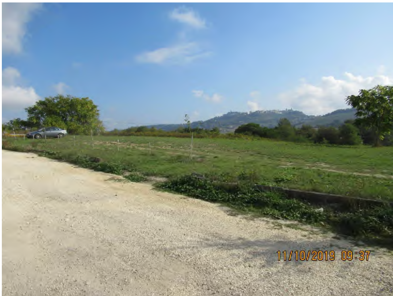
VISTA AREE DI PL